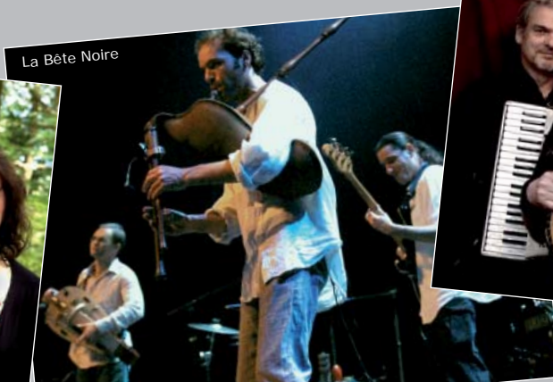
La Bête Noire